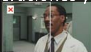
DR. DOLITTLE 2