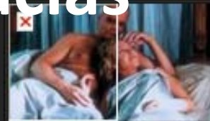
ANTIQUA VIDA MIA