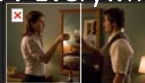
DURA DE LIGAR