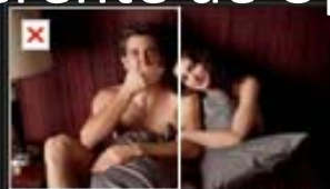
DE AMOR Y OTRAS ADICCIONES